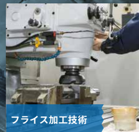
フライス加工技術