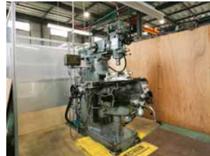
牧野フライス製作所 KGJP-55