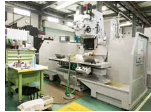
山崎技研 YZ-500WR (2台)