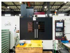
OKK VM7 III