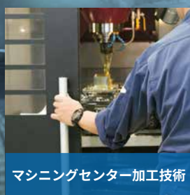
マシニングセンター加工技術