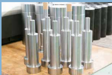
各種ロングノズル