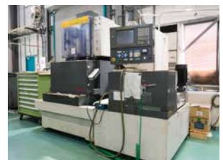
FANUC ROBOCUT α-1C