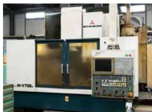
三菱重工工作機械 M-V70En