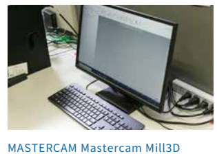
MASTERCAM Mastercam Mill3D MASTERCAM Mastercam Mill2.5D