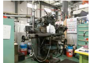
牧野フライス製作所 2KG